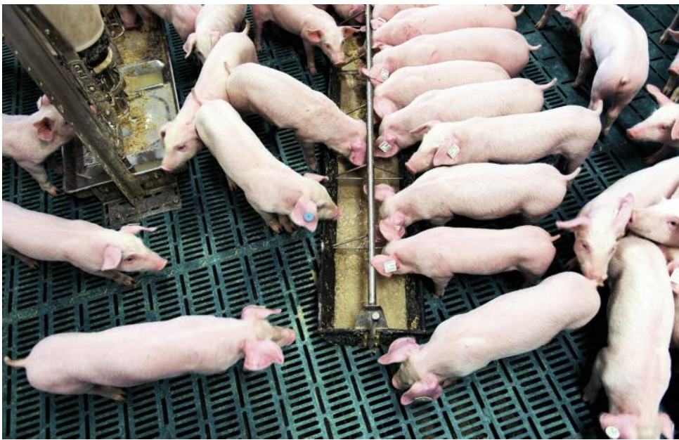
Schweine in konventioneller Mast: „Der Pharmaindustrie in die Hände spielen“

sie weiterhin fehlen. Die Neuzulassungen der letzten Jahre richten sich vor allem gegen den „Krankenhauskeim“ MRSA und Tuberkulosekeime. „Vonseiten der Regierungen müssen dringend finanzielle Anreize für die Pharmaindustrie geschaffen werden, ganz neue Antibiotika-Klassen zu entwickeln“, fordert Lothar Wieler, Präsident des Robert Koch-Instituts (RKI).